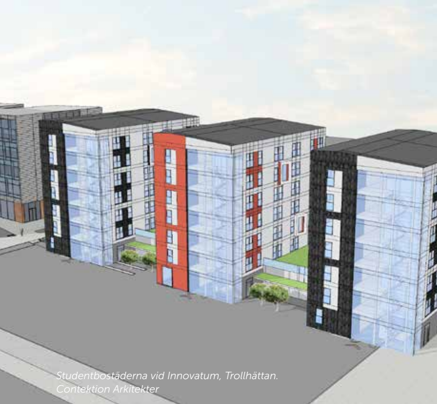
Studentbostäderna vid Innovatum, Trollhättan. Contektion Arkitekter