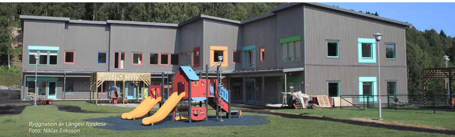
Byggnation av Långevi förskola