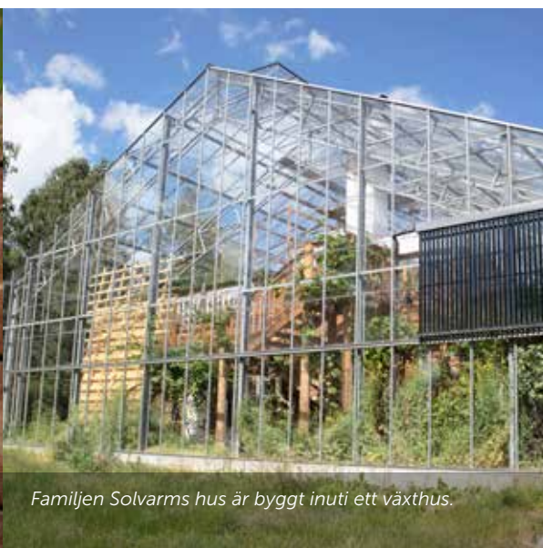
Familjen Solvarms hus är byggt inuti ett växthus.