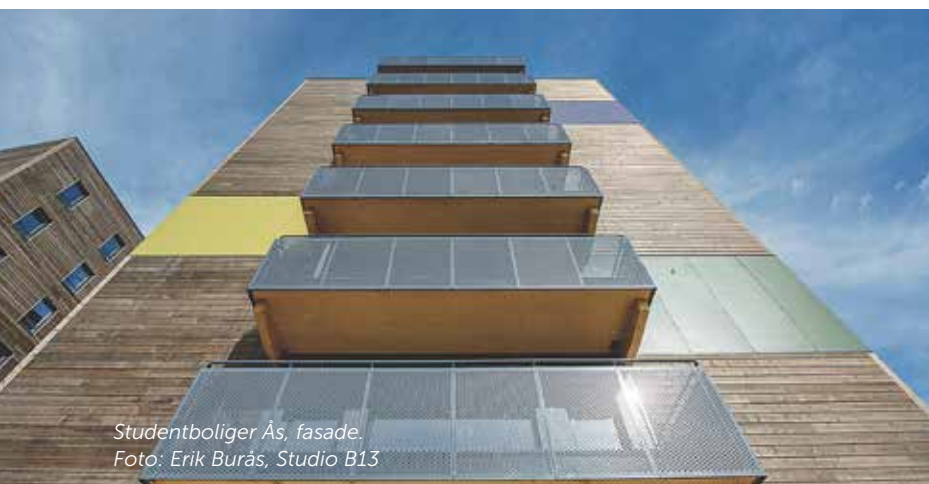
Studentboliger Ås, fasade.