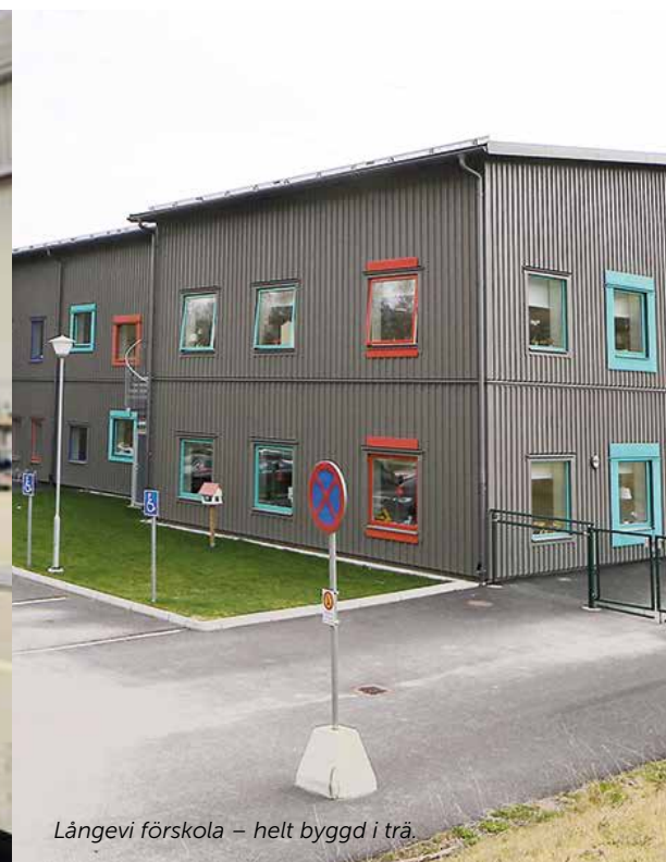
Långevi förskola – helt byggd i trä.

till att SJB började att spika prefabricerade väggar i större skala i anläggningen hemma i Ed. Första projektet med Max restauranger har följts av flera restauranger och därtill flerbostadshus, förskolor och villor.