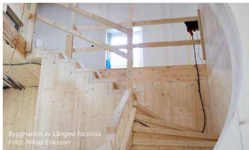
Byggnation av Långevi förskola