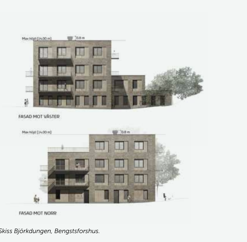
Skiss Björkdungen, Bengtsforshus.