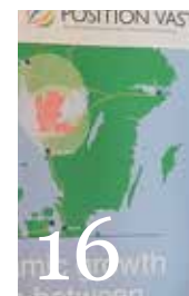
16 Samverkan för att underlätta etableringar