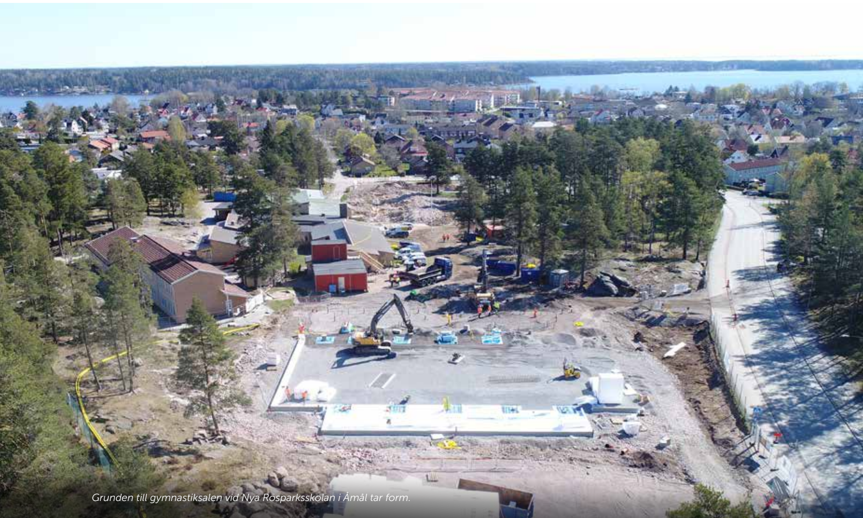
Grunden till gymnastiksalen vid Nya Rösparcksskolan i Åmål tar form.