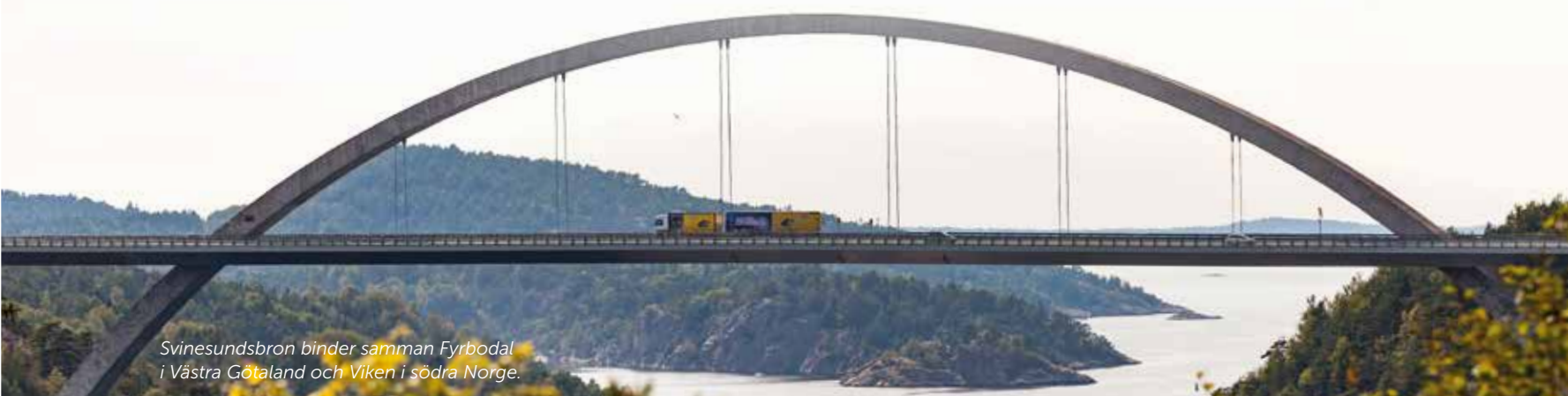
Svinesundsbron binder samman Fyrbodal i Västra Götaland och Viken i södra Norge.

TEXT: MALIN HUSÅR