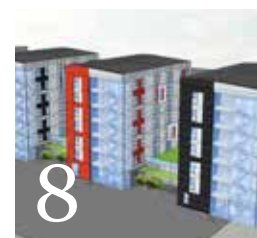
8 Kommuner som bygger i trä