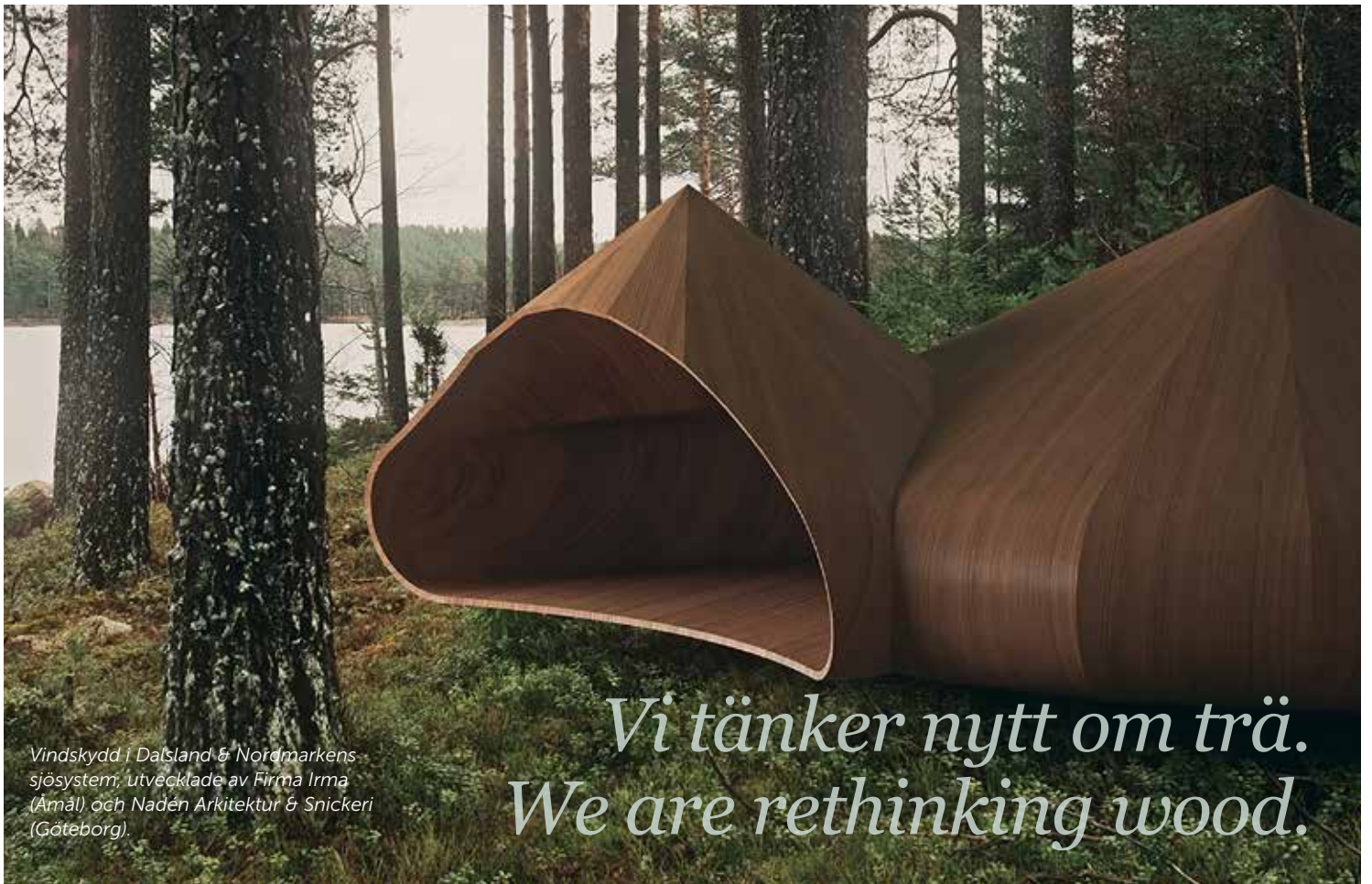
Vindskydd i Dalsland & Nordmarkens sjösystem, utvecklade av Firma Irma (Åmål) och Naden Arkitektur & Snickeri (Göteborg).

Vi tänker nytt om trä. We are rethinking wood.