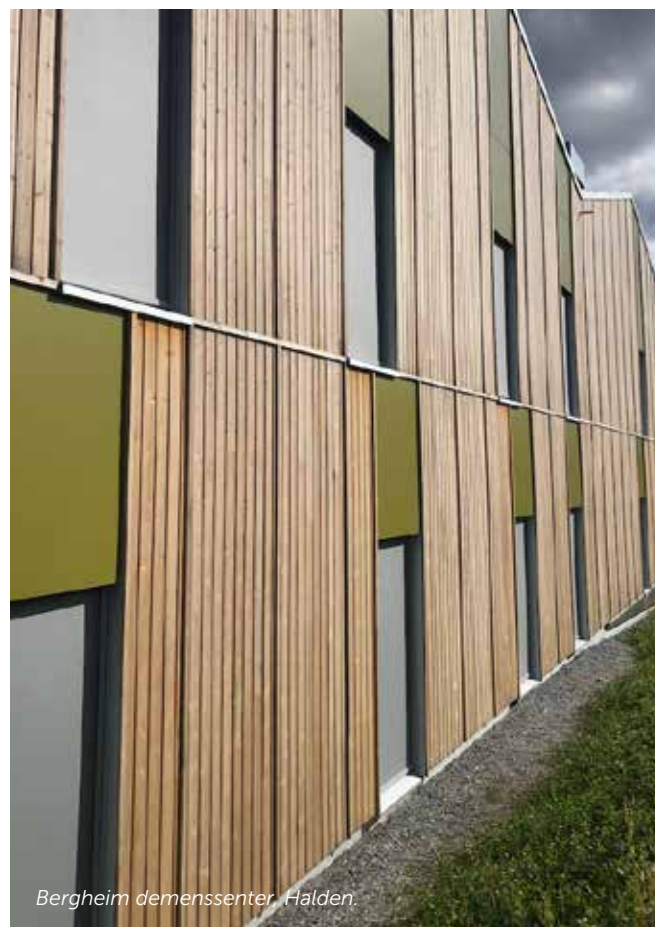
Bergheim demenssenter, Halden.