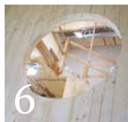
6 Bjørn Lier vil bytte ut mer betong og stål med tre

Rethinking wood är ett norsk-svenskt samarbete för miljö och framtid. Vi främjar användningen av trä för byggnation, möbler, inredning och många andra produkter med träfibern som råvara. Vi arbetar för att företag som arbetar med trä ska utvecklas och etableras och för att fossila material ska bytas mot förnybart trämaterial. Under 2018–2020 drevs arbetet i projektform – Grön Tillväxt Trä – finansierat av Interreg Sverige-Norge och Västra Götalandsregionen och av parterna Fyrbodals kommunalförbund, Position Väst, Svinesundskommittén, Viken fylkeskommune (tidigare Østfold fylkeskommune).