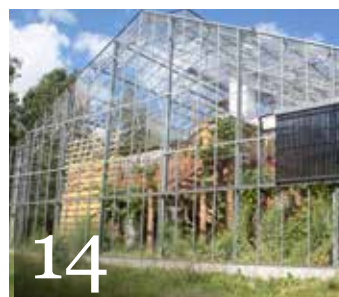
14 Kretsloppstänk och korslimmat trä i unik kombination