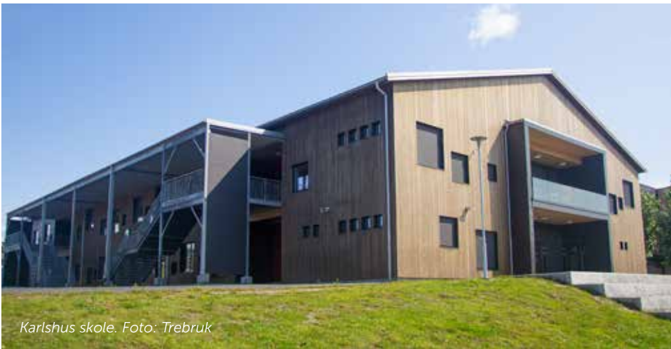
Karlshus skole.