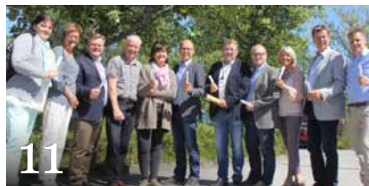
11 Ordfører for tre – kampanj for å redde miljøet